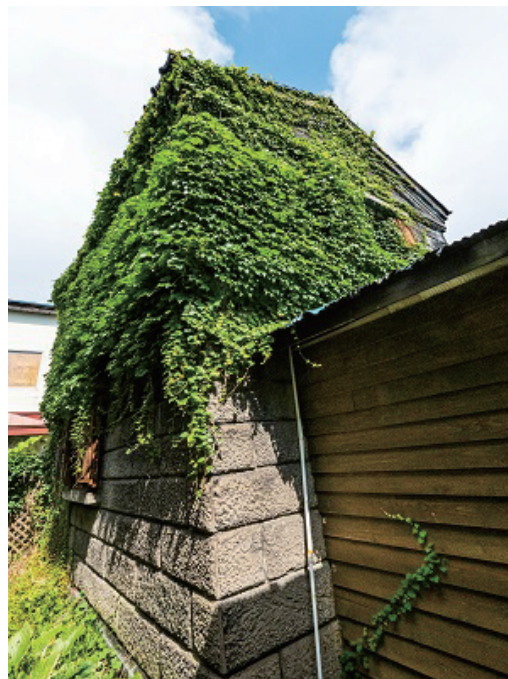
▲石けんショップ外観