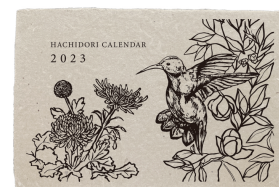
▲2023年度カレンダー (表紙完成イメージ)

2023年度のカレンダーは、はちどりプロジェクトのホームページから購入することができます。お届けは年末になりますので年越し前に新しい1年に向けて自分や大切な人へのプレゼントにいかがですか？