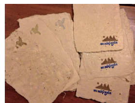
▲2014年のオークンコー

カレンダーに使う紙、オークンコー（カンボジアの綿と井戸水で漉いた紙）の制作がカンボジアで始まった時は、およそ紙とは言えないような状態でした。