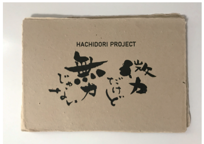
▲2019年はちどりカレンダー