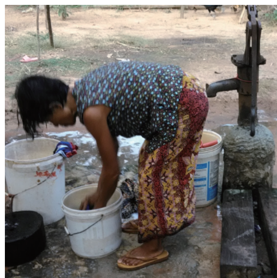
▲井戸のまわりで洗濯をする村人

にやさしいものを村でつくることで、世界に脱合成界面活性剤を呼び掛けていけたらと思っています。